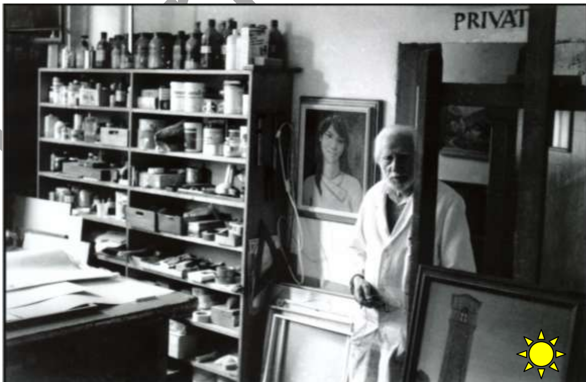
TITOLO: Atelier – Philip Siegrist