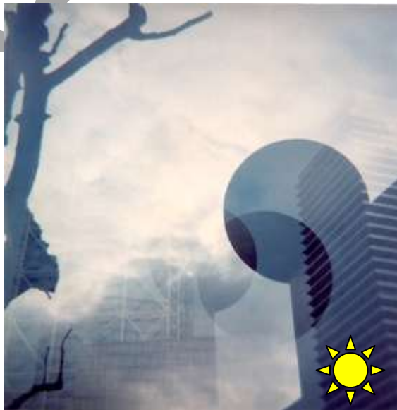
TITOLO: Points of view – Omar Elabed